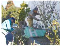
佐倉東小のバラ剪定