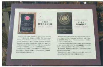
設置されたプレート

佐倉草ぶえの丘バラ園は、2013年(平成25年)に、アジアで初めて、アメリカのカリフォルニア州サン・マリノ市にある教育研究機関ハンチントン・ライブラリーから、「殿堂入りバラ園」に、選ばれています。殿堂入りの理由は、同バラ園が、バラの歴史の重要性を日本のバラ界に啓蒙することにより多大な貢献をしたこと、そして、ボランティアの力を結集して、貴重品種の収集と保存に偉大な業績を残したこと、さらに、その重要性を、より多くの皆さんに訴えたこと等によるものです。また、2015年(平成27年)5月27日から6月4日まで、フランス・リヨンで開催された世界バラ会連合主催の第17回世界バラ会議において、京成バラ園、熱海市のアカオハープ&ローズガーデンと共に、優秀庭園賞を受賞しています。これは、ガーデンの美しさと魅力、メンテナンスの質の高さ、一般人々への影響力、バラとバラ文化の普及実績等が高く評価されての受賞となったものです。殿堂入りバラ園表彰と、優秀庭園賞のダブル受賞は、アジアで唯一、佐倉草ぶえの丘バラ園だけで、世界からも高い評価を得ています。なお、優秀庭園賞は、これまでに、世界21か国で42か所のバラ園が受賞しており、日本国内では、花フェスタ記念公園(岐阜県)、福山市ばら公園(広島県)、朝(うつぼ)公園バラ園(大阪府)、神代神代植物公園(東京都調布市)が選ばれています。この受賞を記念して、2016年(平成28年)5月30日(月)に、佐倉草ぶえの丘バラ園の入口に、記念のプレートが設置されました。