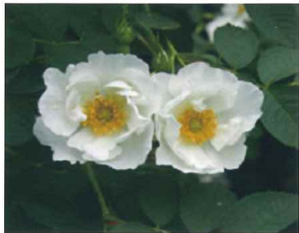
アルバ・セミプレナ

バラ文化研究所は草ぶえの丘バラ園を運営する前、「ローズガーデンアルバ」を運営していました。このバラ園に植えられていたバラが全て草ぶえの丘バラ園に寄贈され、現在も美しい花を咲かせています。