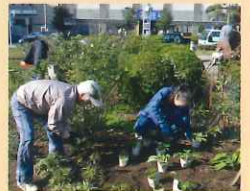
JR佐倉駅北口整備事業

以上の事業については、予定ということで、今後、変更になることもありますので、ご了承ください。皆さんも何か事業のアイデア、ご意見等がございましたら、事務局までお知らせいただければ幸いです。