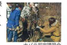
木バラ剪定講習会

NPOバラ文化研究所とのコラボレーションにより、平成29年1月14日(土)と、平成29年2月4日(土)に佐倉草ぶえの丘バラ園で行われました。つるバラの誘引や、木バラの剪定は、春に咲く花の位置や、見た目を美しくするために必要で、この時期に誘引や剪定を行うことで、木が力を蓄え、春には一斉につぼみをつけて時期を同じくして花を咲かせます。参加した皆さんには、剪定バサミを使い、春に咲くバラの位置や風景を想像しながら、枝をポールやスクリーンに結びつたり、また、実際にバラの枝を剪定したりして、約1日かけた実習を通して、誘引や剪定の技術を学んでいただきました。