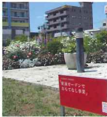
JR佐倉駅前ガーデン