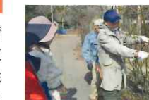
つるバラ誘引講習会

NPOバラ文化研究所とのコラボレーションにより、平成29年1月14日(土)と、平成29年2月4日(土)に佐倉草ぶえの丘バラ園で行われました。つるバラの誘引や、木バラの剪定は、春に咲く花の位置や、見た目を美しくするために必要で、この時期に誘引や剪定を行うことで、木が力を蓄え、春には一斉につぼみをつけて時期を同じくして花を咲かせます。参加した皆さんには、剪定バサミを使い、春に咲くバラの位置や風景を想像しながら、枝をポールやスクリーンに結びつたり、また、実際にバラの枝を剪定したりして、約1日かけた実習を通して、誘引や剪定の技術を学んでいただきました。