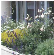
志津コミュニティセンターのガーデン

佐倉ばら会では、平成24年度から佐倉市との協働事業により、JR佐倉駅北口前の景観整備事業を担当しています。これは、佐倉市の観光のテーマでもある「花」を生かし、観光客へのおもてなしの心を表現するため、佐倉市の玄関口ともいえるJR佐倉駅北口前の景観の整備を行うもので、平成28年度も引き続き、通常の管理と併せ、刈り込み、草刈り、植物の植え替え等を、年5回(4月・7月・9月・11月・2月)行いました。 また、佐倉市との協働事業ではありませんが、志津コミュニティセンターのミニガーデンの草刈り、植栽等も同時期に実施しました。