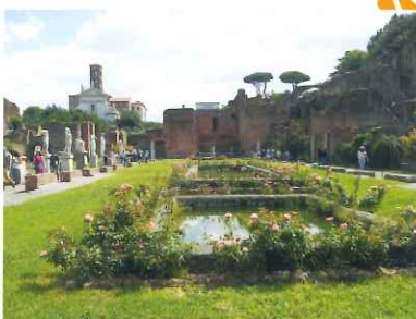
フォロ・ロマーノ