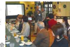
会員同士の親睦を深めた懇親会

平成28年度の会員懇親会が、平成27年11月23日(水)に、八千代市勝田台北の貝殻亭2階のガーデンサロンで開かれました。この懇親会は、会員の皆さんが、一堂に会し、会員相互の親睦を深めるために、開催されています。参加された皆さんは、美味しいランチをいただきながら、素晴らしい庭園の観賞、バラにまつわる話や、平成28年度の企画事業について等、祝日のひと時、楽しい時間を過ごし、会員同士の交流を図りました。なお、今回は、参加会員の有志の皆さんが、クイズを作成するなどして、懇親会を大いに盛り上げていただきました。