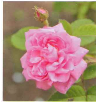
ロサ・ケンティフォリア

ケンティは、「100」、フォリアは「花」、100枚の花弁を持つバラという意味であり、現代バラに花弁の多さ、巻きの厚さをもたらした系統です。マリー・アントワネットがこのバラを持っている絵はあまりに有名です。樹勢はあまり強くなく、花が、まばらに咲きますが、それがまた魅力となっています。南フランスで香料を採るために盛んに栽培されたので、プロバンスローズと呼ばれています。