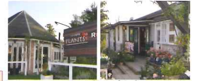
ローズヒップ&ブランツ(左右)

とローズガーデンショップがあり、バラに関するあらゆる用品の購入が出来るお店です。