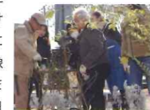
木バラ剪定講習会

NPOバラ文化研究所とのコラボレーションにより、平成30年1月20日(土)、平成30年2月17日(土)に行われました。例年、佐倉草ぶえの丘バラ園で行っているこの講習会ですが、今回は、佐倉草ぶえの丘が全館改修工事で休園中でしたので、会場を、八千代市の貝殻亭リゾートガーデンに移して行われました。つるバラの誘引や、木バラの選定は、春に咲く花の位置や、見た目を美しくするために必要で、この時期に誘引や剪定を行うことで、木が力を蓄え、春には一斉につばみをつけて時期を同じくして花を咲かせます。参加した皆さんには、剪定バサミを使い、春に咲くバラの位置や風景を想像しながら、枝をポールやスクリーンに結びつけたり、また、実際にバラの枝を剪定したりして、それぞれ約1日かけた実習を通して、誘引や剪定の技術を学んでいただきました。