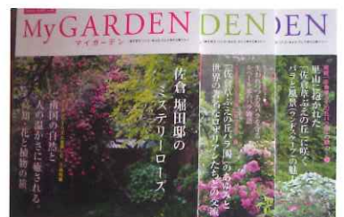
佐倉草ぶえの丘バラ園が紹介されている雑誌「マイガーデン」

ガーデニングの総合情報季刊誌「My GARDEN(マイガーデン)」の83号(2017年夏号)、84号(2017年秋号)、85号(2018年早春号)、86号(2018年春号)の4号にわたって、今号の本紙で紹介した佐倉 堀田邸の『ミステリーローズ』を含む、佐倉草ぶえの丘バラ園について、特集で紹介されていますので、興味のある方は、ぜひご覧ください。バックナンバーの取り扱いも行っています。問い合わせは、株式会社マルモ出版(☎03-3496-7046)までお願いいたします。なお、ホームページからの申し込みも出来ます。 http://www.marumo-p.co.jp/