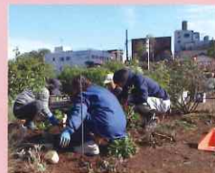
JR佐倉駅北口前景観整備事業

以上の事業については、予定ということで、今後、変更になることもありますので、ご了承ください。皆さんも何か事業のアイデア、ご意見等がございましたら、事務局までお知らせいただければ幸いです。