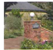
ドリブレ・ローズガーデン入口

例年天候に悩まされる佐倉ばら会の日帰りツアーですが、昨年は天候に恵まれ、会員の皆様と日ごろの喧嘩から離れ、親交を深めることができました。今回の訪問地は千葉県内ということで、最初は、君津市にあるバラ園「ドリブレ」、最盛期を終えようとする秋バラを楽しむことができました。敷地内にある特徴的なシークレットガーデンを楽しんだりもしました。ドリブレを後に、木更津のアサリを使った老舗レストランでランチをいただき、近隣の道の駅でお土産を購入し、最終訪問地「ローズヒップ&ブランツ」に向かいました。苗の販売スペースとカフェ、スタッフがメンテナンスするガーデンが広がるエリア、地元の方々と混み合う場所なのだろうとすぐ感じました。会員の皆さんは、お土産に大苗を買ったり、また、コーヒーを飲みながらそれぞれ親交を深めたりと、有意義な時間を過ごされたようでした。