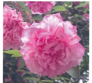
「ミステリーローズ」

その後、この言葉は、次第に意味が広がり、現在では、世界各地の「名前や由来が分からなくなってしまったけれど、その地域の気候に合って長く栽培されてきたバラ」を指す言葉として使われているそうです。同じように、「ファウンドローズ」という言葉が使われることもあり、名前が決められないバラは、枝変わりか実生の可能性が高いのですが、その中から、園芸価値の高いバラが発見されることもあるということです。【出典：「マイガーデン」（マルモ出版）85号（2018年早春号）】