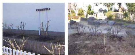
剪定後の佐倉東小のバラ園 剪定後の佐倉小のバラ園

【佐倉地区】佐倉小・内郷小・佐倉東小・白銀小・佐倉東中 【白井、志津、千代田地区】白井小・千代田小・染井野小・下志津小・西志津小・小竹小・青菅小・白井南中