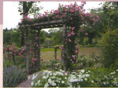
佐倉草ぶえの丘バラ園

「佐倉草ぶえの丘バラ園」は、世界的にも高く評価されており、平成26年(2014年)には、アメリカのカリフォルニア州サン・マリノ市にある教育研究機関ハンチントン・ライブラリー、アートコレクションズ&ボタニックガーデンズにあるグレートロザリアンズオブザワールドプログラム(The Great Rosarians of the World Program)から殿堂入りバラ園の表彰を受け、平成27年(2015年)には、世界バラ会連合から、優秀庭園賞を受賞しています。このダブル受賞は、アジアで唯一、「佐倉草ぶえの丘バラ園」だけです。また、「佐倉草ぶえの丘バラ園資料室」には、鈴木家から寄贈された書籍、愛蔵品等、様々な資料を合わせて約9,400点が所蔵されています。資料室を利用する場合は、佐倉草ぶえの丘事務室までお申し込みください。