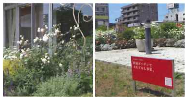
志津コミュニティセンターのガーデン JR佐倉駅前ガーデン

また、佐倉市との協働事業ではありませんが、志津コミュニティセンターのミニガーデンの草刈り、植栽等も同時期に実施しました。