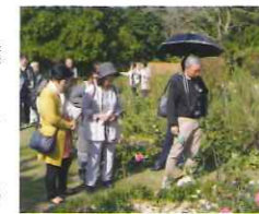
ドリブレ・ローズガーデン

平成29年度の日帰りバスツアーは、10月27日(金)に、秋のローズガーデンを巡るツアーということで、千葉県内のバラの名所を訪ねる旅を実施しました。まず、午前を訪れた場所は、君津市にある「ドリブレ・ローズガーデン」(The Dreaming Place ROSE GARDEN)で、東京にお住まいのご夫婦が、一念発起され君津に土地を求めて移り住み、イギリス風のガーデンを作ったのが始まりです。広さ約16,500㎡の敷地に、メインガーデン約3,900㎡、シークレットガーデン約992㎡、キッチンガーデン約496㎡、北の森約2,645㎡とあり、イギリスから取り寄せたイングリッシュローズとオールドローズが、約350品種、2,000本植えられています。昼食は、木更津伝統のあさり料理を堪能し、午後は、袖ヶ浦市にある「ローズヒップ&ブランツ」を見学しました。同所は、バラの苗の専門店、レストラン