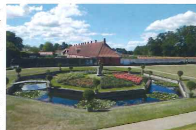
フレデリクスボーク城の広大な庭

【世界バラ会連合】本部は、イギリスのロンドンにあり、現在約 40 か国が加盟しています。3 年に 1 度の世界会議のほかに、地域大会や、 ヘリテージローズ会議を実施し、加盟国間のバラ愛好家の親善や、情報交換、知識の共有、研究の促進、バラの分類、審査基準の標準化 等に取り組んでいます。