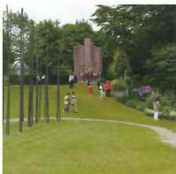
クレマチスの丘で

呼ばれるヴァンジ彫刻庭園美術館の中にある庭園で は、クレマチスが約 250 種、2,000 株植栽されており、 年間を通じて美しい花々を楽しむことができます。 当会が訪れた時には、バラをはじめとした春の花が 美しく咲き誇っていました。昼食は、沼津リバーサ イトホテルで、地元の食材に、世界のエッセンスを 散りばめたランチブッフェを楽しみました。参加 された皆さんは、春の 1 日を、会員同士の親睦を深 めながら、有意義に過ごされたようでした。