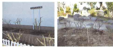
剪定後の佐倉東小のバラ園 剪定後の佐倉小のバラ園