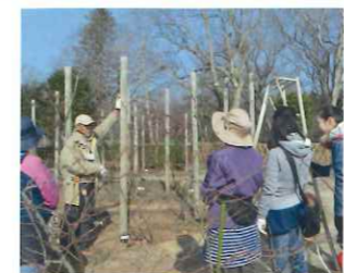
つるバラ誘引講習会

NPO 法人バラ文化研究所とのコラボレー ションにより、平成 31 年 1 月 30 日(水)に、 つるバラの誘引講習会が、佐倉草ぶえの丘バ ラ園で行われました。 バラの誘引や剪定は、新旧の枝を更新し、 全ての枝が太陽の光にあたり、風通しが良い 状態となるように樹形を整えます。 さらに、バラの健康状態を観察して、生育 不良や病害虫等があれば、適切に処理をし