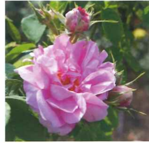
ロサ・ダマスケナ

ブルガリアの「バラの谷」ではこのバラが栽培され、香油が抽出されて世界中に香料として出荷されています。古くよりこの香りはバラの代表として扱われ、現在はクラシック・ダマスクとモダン・ダマスクに分類され、ダマスクローズは香りのルーツと称されています。 佐倉草ぶえの丘バラ園には「香りのコーナー」がありますので、5月中旬ごろにはぜひ訪れて、その濃厚な甘い香りを楽しんでください。