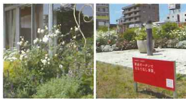
志津コミュニティセンターのガーデン JR佐倉駅前ガーデン

また、佐倉市との協働事業ではありませんが、志津コミュニティセンターのミニガーデンの草刈り、植栽等も同時期に実施しました。