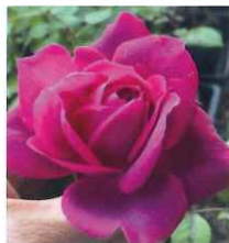
（新品種のバラ）開発番号 RCI 07 香り：強烈なモダン・タスク香 季咲き性：完全四季咲き 樹勢：強健 樹高：1.5メートル

新潟県長岡市の国営越後丘陵公園が主催。越後丘陵公園には、ばらの香りを 6 種類に分類して植え込み、それぞれのブロック毎に違った系統のばらの香りを楽しむばら園がある。