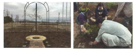
整備されたバラ花壇 バラ苗の植え込み

佐倉ばら会では、平成30年11月7日(水)に、千代田・染井野まちづくり協議会、染井野小学校、佐倉市教育委員会等の協力をいただき、染井野小学校のバラ花壇の整備事業を実施しました。これは当初の整備から年月が経過したことで、改めて土壌等の改良を行うことを目的に行ったもので、当日は、従前の花壇を重機で掘り起こし、疲弊した土を処分し、新たにトラックで土と肥料を投入し、バラの苗と、花苗の植え込みを行う、本格的な整備を行いました。佐倉ばら会では、この花壇に美しい花が咲き、小学生のみなさんの豊かな心の醸成に繋がっていくことを願っています。当日、ご協力いただいた皆様には改めて感謝申し上げます。