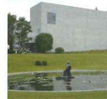
クレマチスの丘で

平成 30 年度の日帰りバスタツアーは、5 月 25 日(金)に、静岡県駿東郡長泉町 にある「クレマチスの丘」を訪れました。クレマチス の丘は、北に富士山、南に駿河湾を望む文化と自然が 一体となったエリアにある絶景アートのスポット。3 つ の美術館と文学館、さらに 4 つのレストランとカフェ、 ミュージアムショップ等が併設された「花・アート・食」 がコンセプトの複合文化施設です。長泉町は、全国の クレマチス生産の約 6 割を占める日本一のクレマチス の産地で、その関連もあり、「クレマチスガーデン」と