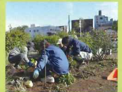
JR佐倉駅北口前景観整備事業

以上の事業については、予定ということで、今後、変更になることもありますので、ご了承ください。皆さんも何か事業のアイデア、ご意見等がございましたら、事務局までお知らせいただければ幸いです。